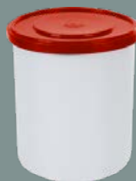
600ML - SEM LACRE