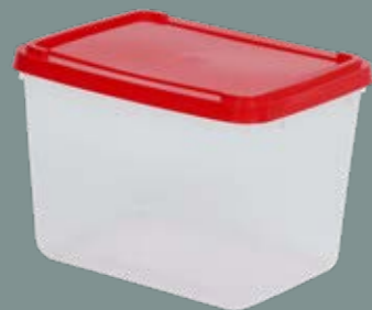
1,5L - SEM LACRE