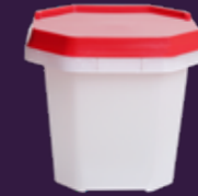
220ML TAMPA RETA (COM LACRE)