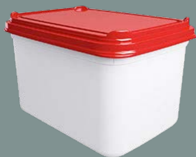
2L - SEM LACRE