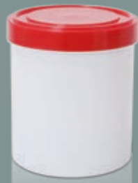
600ML - TAMPA ROSQUEÁVEL