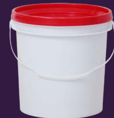
3,6L - REDONDO (COM LACRE)