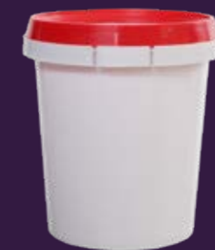
500ML - ALTO (COM LACRE)