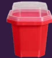
220ML TAMPA GRANOLA (COM LACRE)