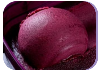
ÇAÍ COM GESCREAM